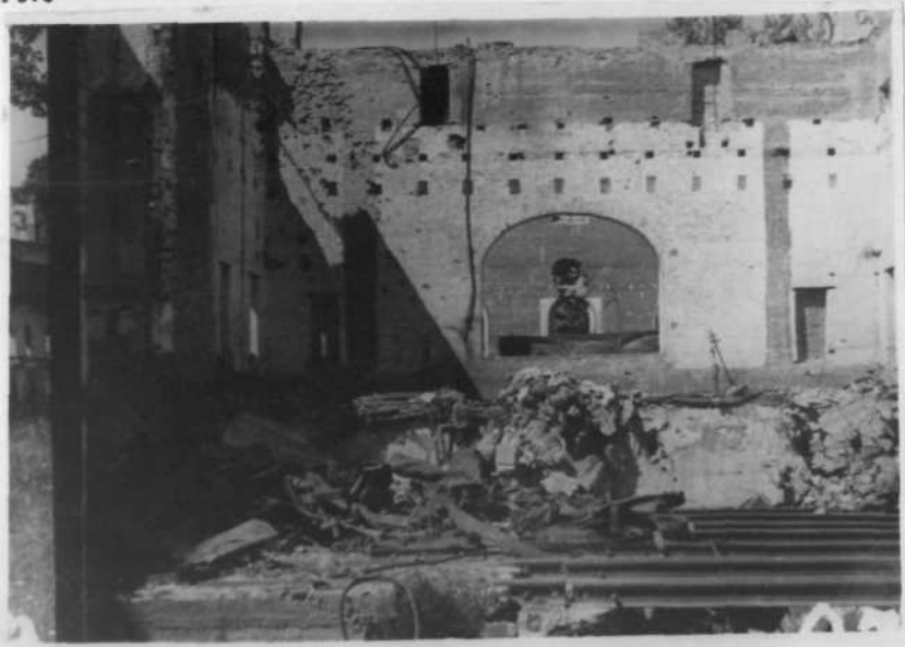
Интерьер после разрушения.

Управление ДК дворцами и парками П-го Пригородный район в Детское Село.