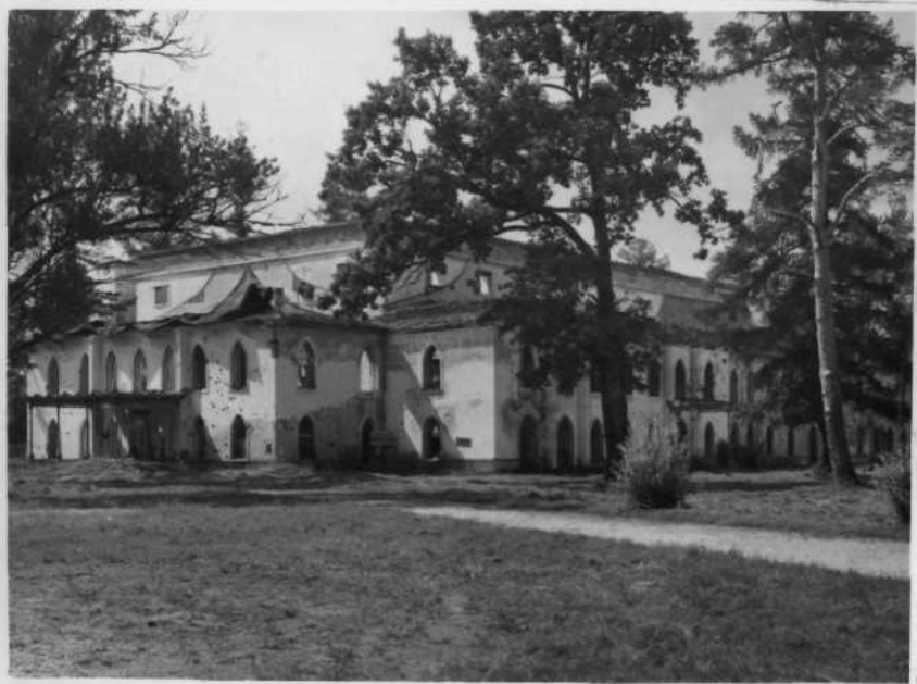
Общий вид после разрушения.