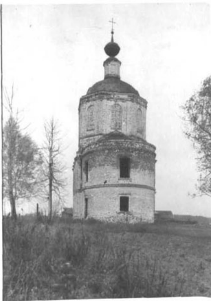
Р. Т. О. Ч. К. А. (оборотная сторона)