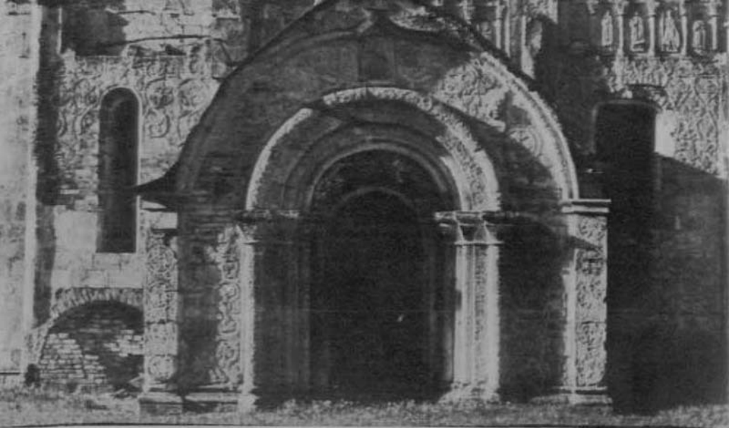
Տուօժեի-Միօնիչեան Տեօքսիէի մտքն շտժոթ ռոմաթ 1230: արքայ զիմառնիւնսն