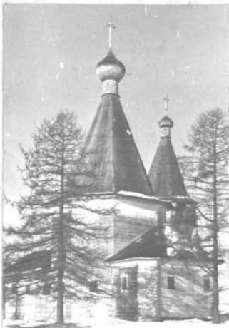
ОЧКА (оборотная сторона)