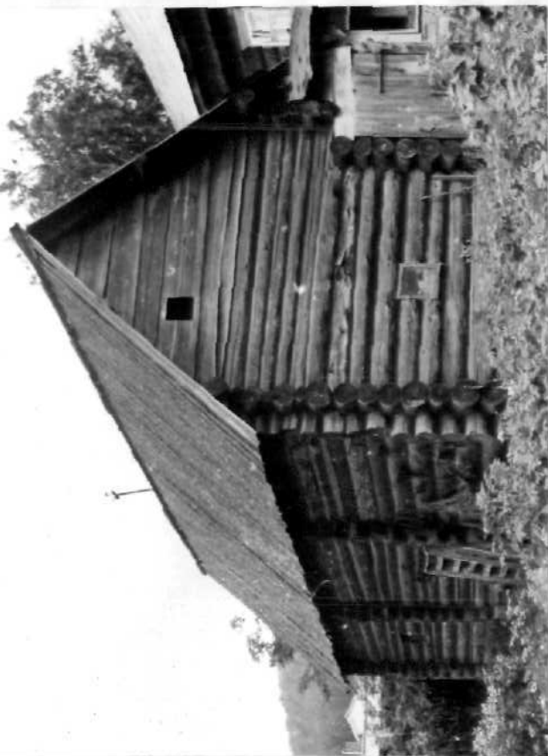
ГОЧКА (оборотная сторона)