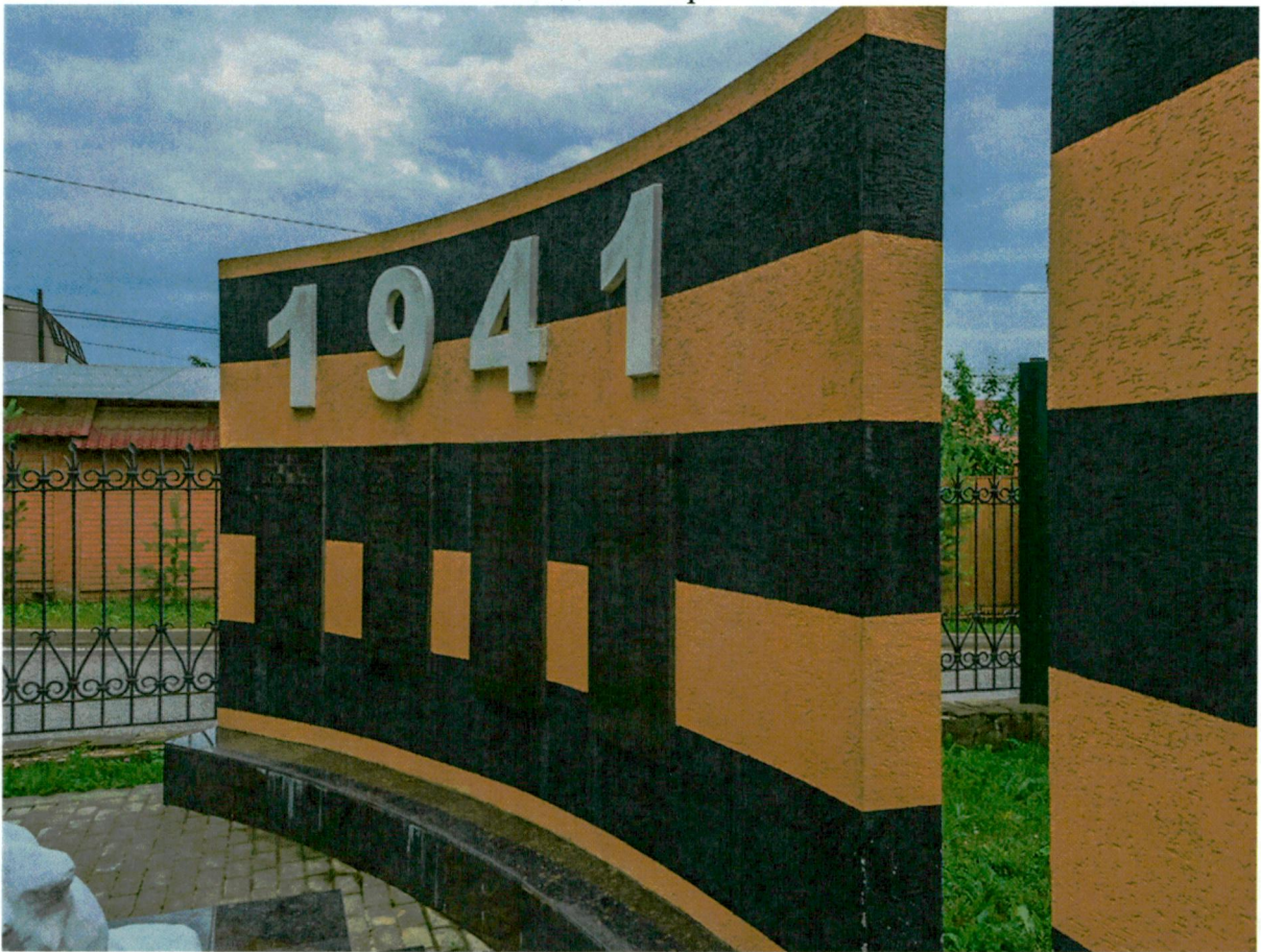
9. Вид с запада