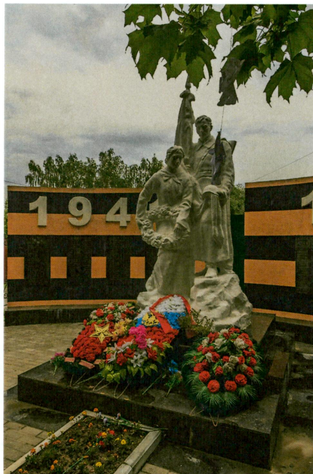
3. Вид с северо-запада