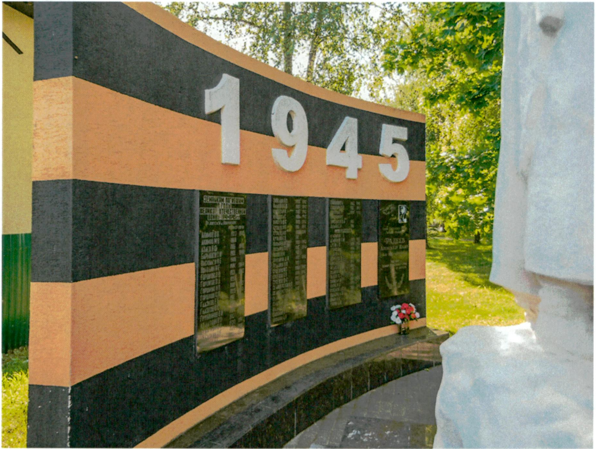
8. Вид с северо-востока