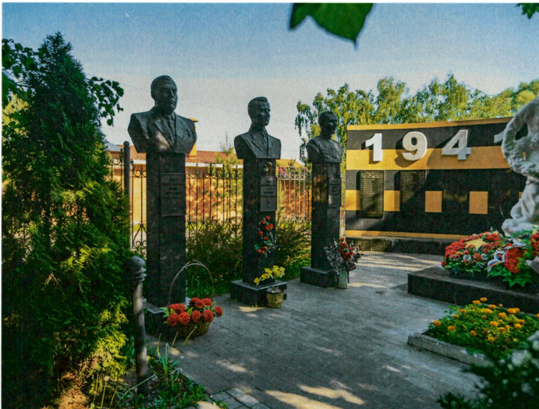
7. Вид с северо-запада