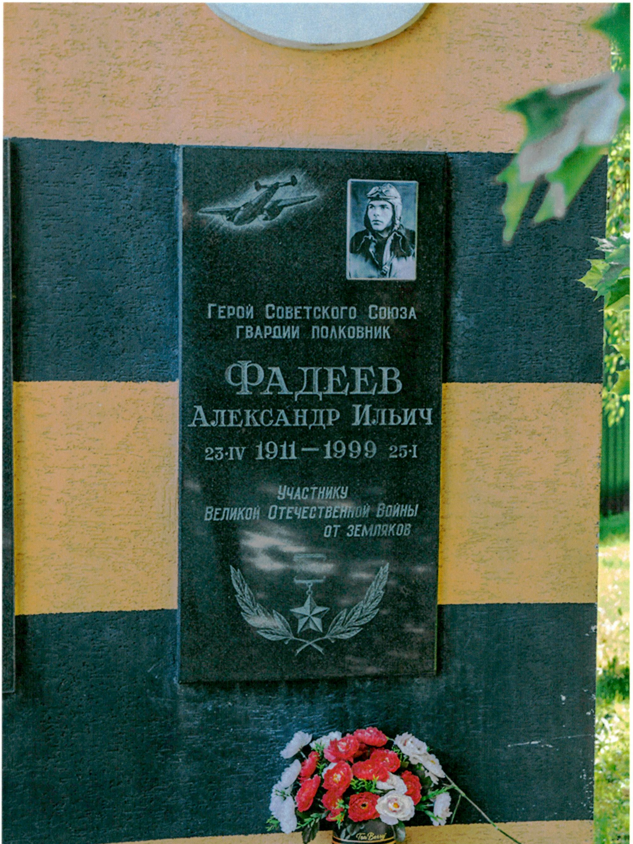
10. Памятный знак Герою Советского Союза А. И. Фадееву