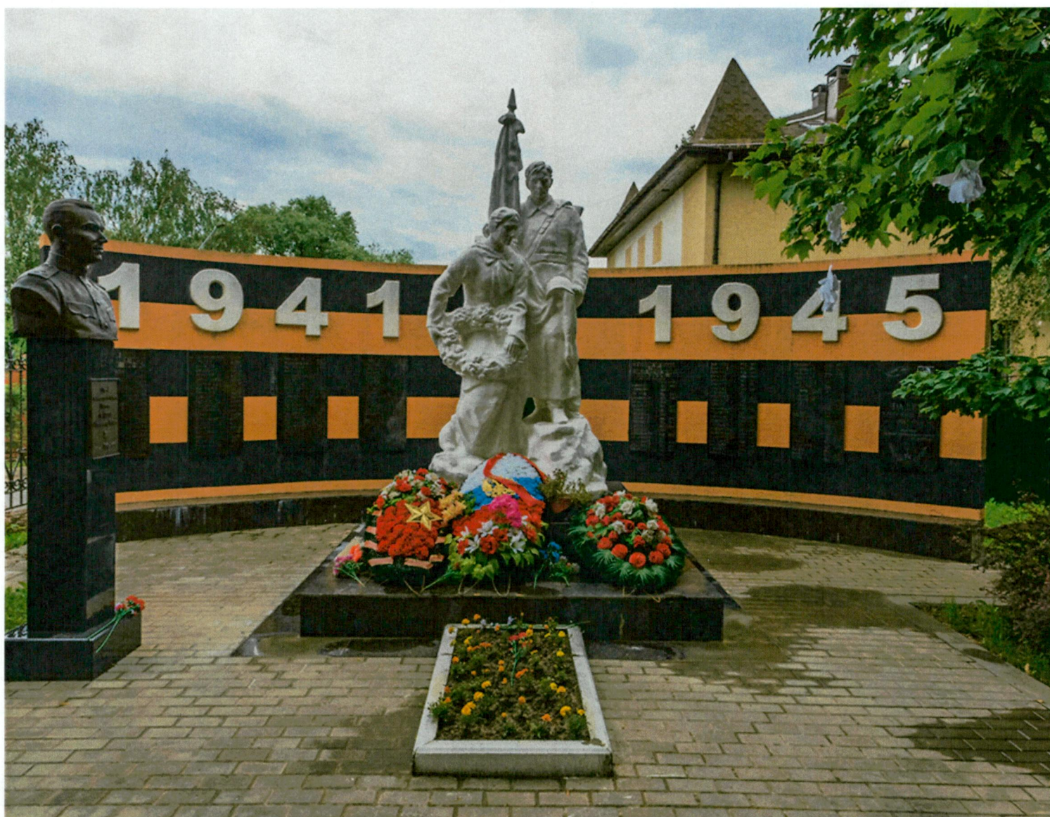
1. Скульптурная композиция «Солдат со знаменем и женщина с венком»

Фотофиксация объекта культурного наследия регионального значения «Братская могила советских воинов, 1941-1942 гг.»