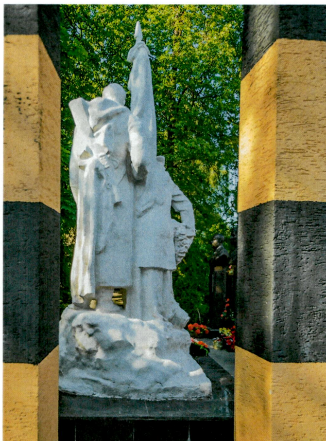
5. Вид с юга