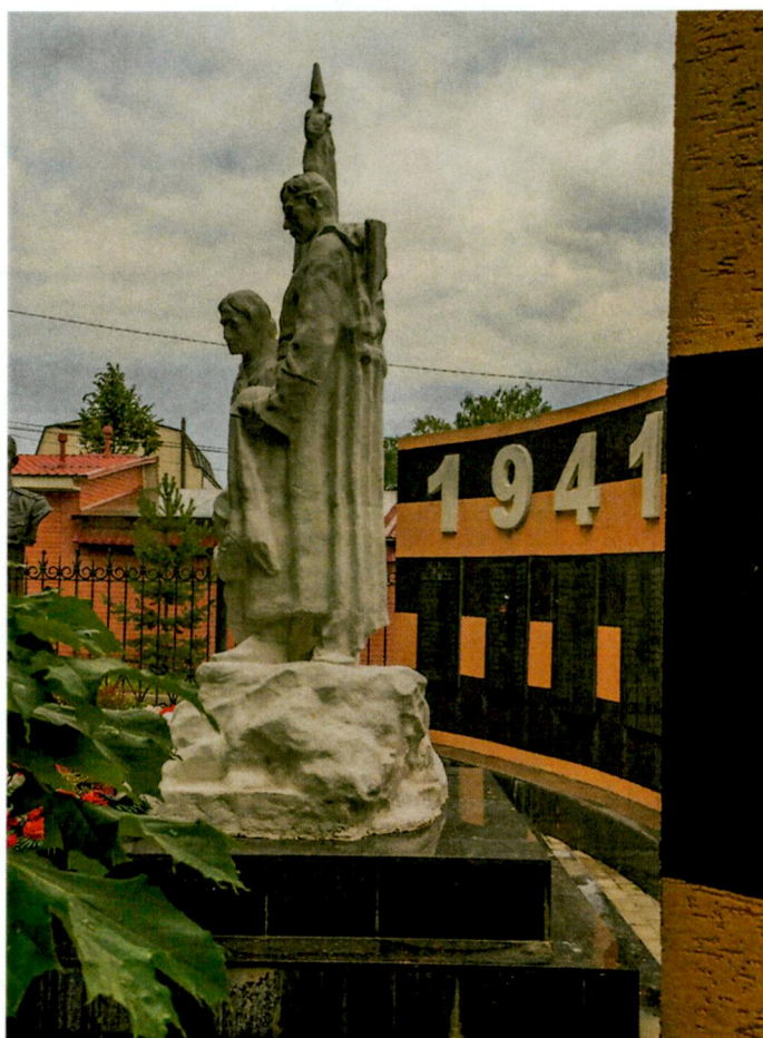
4. Вид с запада