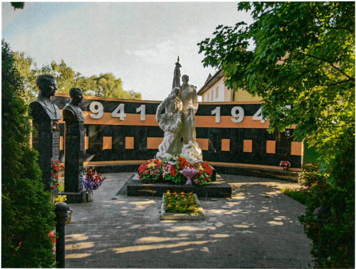
2. Вид с севера