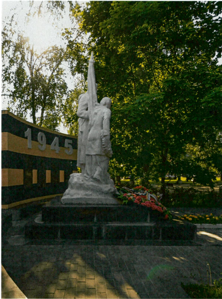
6. Вид с запада