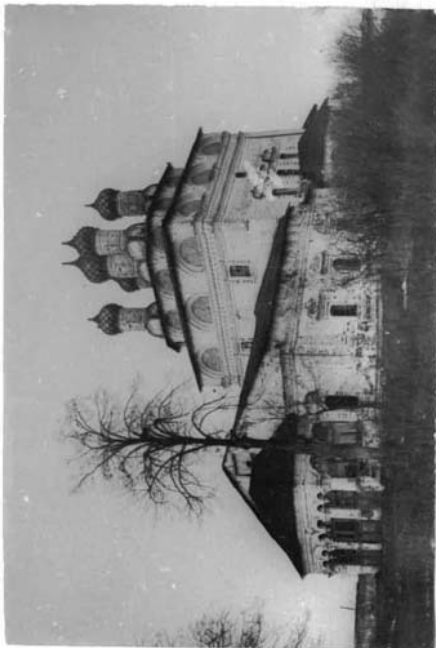
Т О Ч К А (оборотная сторона)