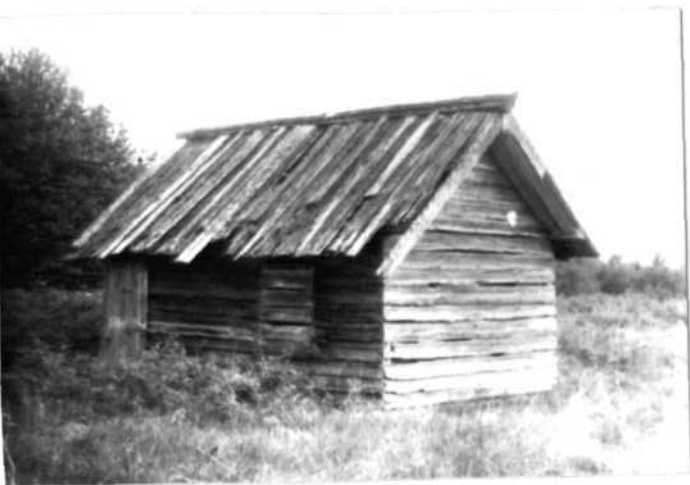
Фото или схематический план