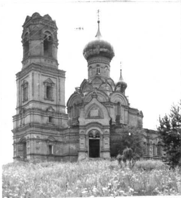
К А (оборотная сторона)

использованы кокошники, ниши, ширинки, Главный иконостас решён в псевдорусском стиле. Один из многочисленных примеров переработки традиций древнерусского зодчества в связи с новыми требованиями архитектуры нач. XX в.