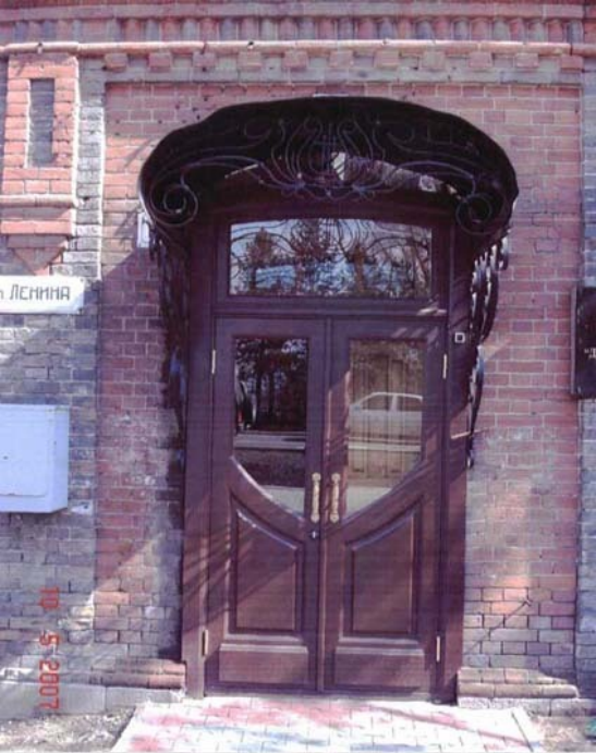
Фото № 6 г. Хабаровск, ул. Ленина, 16 «Дом доходный Л.М. Петренко», до 1898г. Дверь главного входа Май 2007г.