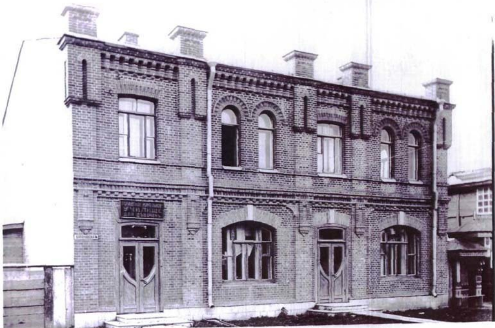
Фото № 13

г. Хабаровск, ул. Ленина, 16, «Дом доходный Л.М. Петренко», до 1898 г.