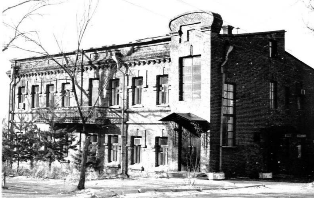
г.Хабаровск, ул.Калинина, 27 б Дом жилой А.И.Душечкина, 1907г. 1989-90 год