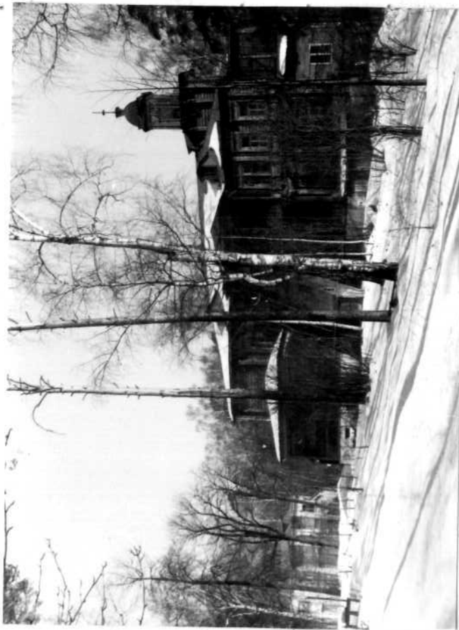
А (оборотная сторона)