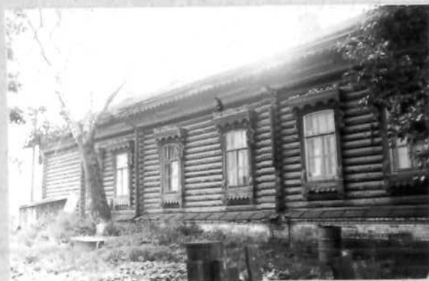
Фото или схематический план