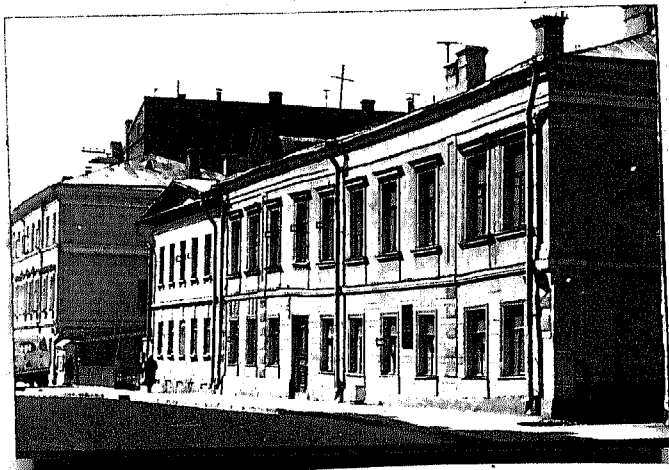
Фото К. П. Головин, 1975.