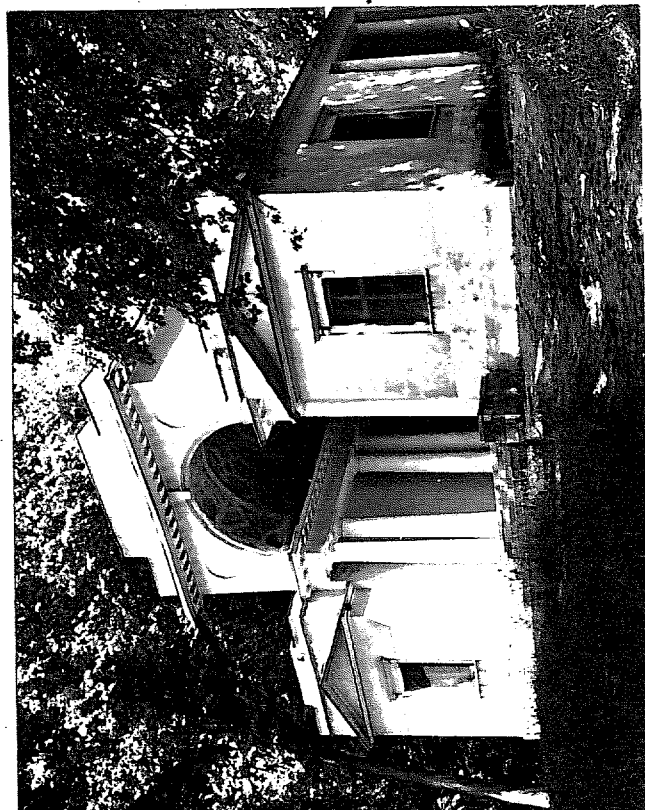
Фото или схематический план