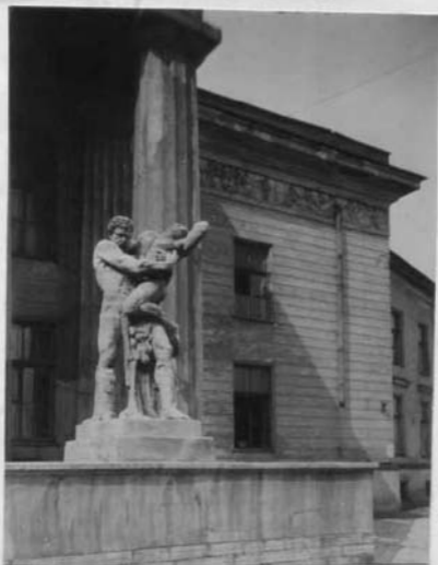
Скульптурная группа "Геркулес, удрученный Антея"