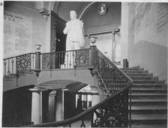
Лестница главного вестибюля