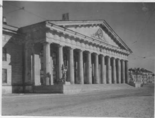
Портик главного фасада