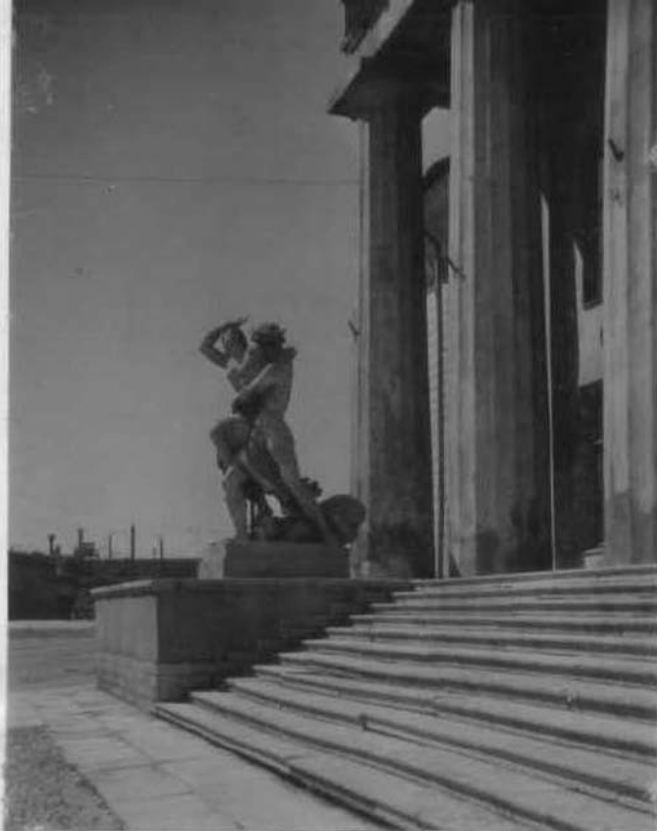
Скульптурная группа "Похищение Прозерпины"