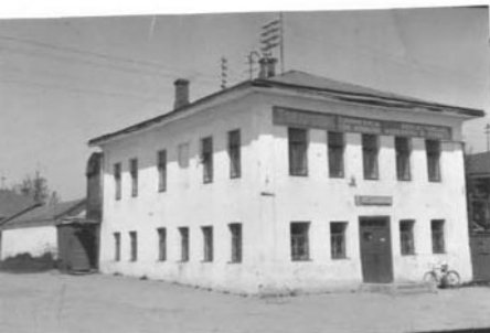
А (оборотная сторона)

Краткое описание Жилой двухэтажный дом расположен на площади. Здание кирпичное, оштукатурено и побелено. Стоит на высоком цоколе, углы фланкированы лопатками. Карниз большого выноса с антаблементом, разделенными продольными филёнками. Крыша четырехскатная, железная. межэтажного карниза не имеет. Окна без наличников. Вход в первый этаж с южного фасада, на второй ведет деревянная лестница в пристройке с северного фасада. Восточная сторона глухая.