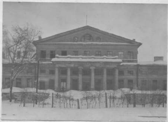
Фасад со стороны сада.