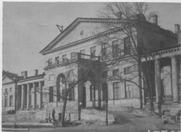
Общий вид со стороны наб. р. Фонтанки.