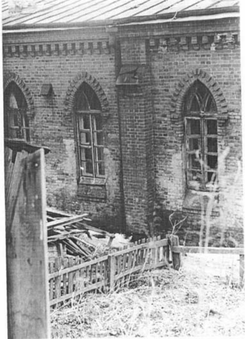
6 г. Хабаровск, ш. Комсомольская, 18 Комплекс зданий артиллерийского склада. 1878 - 1918 гг. Артиллерийский склад - 1886 г. Фрагмент северного фасада.