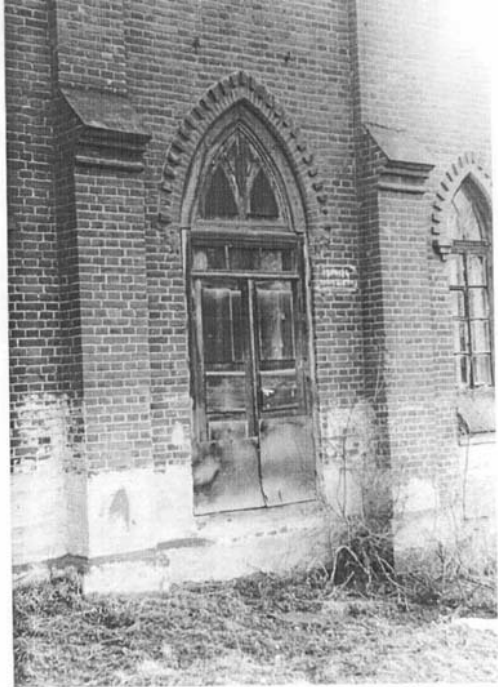
⑤ г. Хаскировск, ул. Комсомольская, 18 Комплексе зданий артиллерийского склада. 1873 - 1918 гг. Артиллерийский склад, 1886 г. Средняя восточная часть западного флигеля.