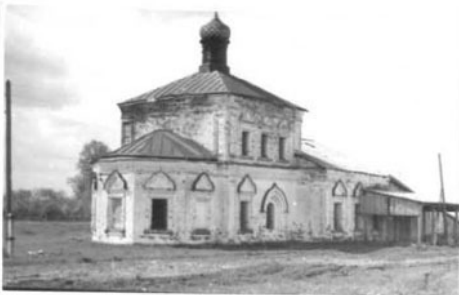
К А (оборотная сторона)