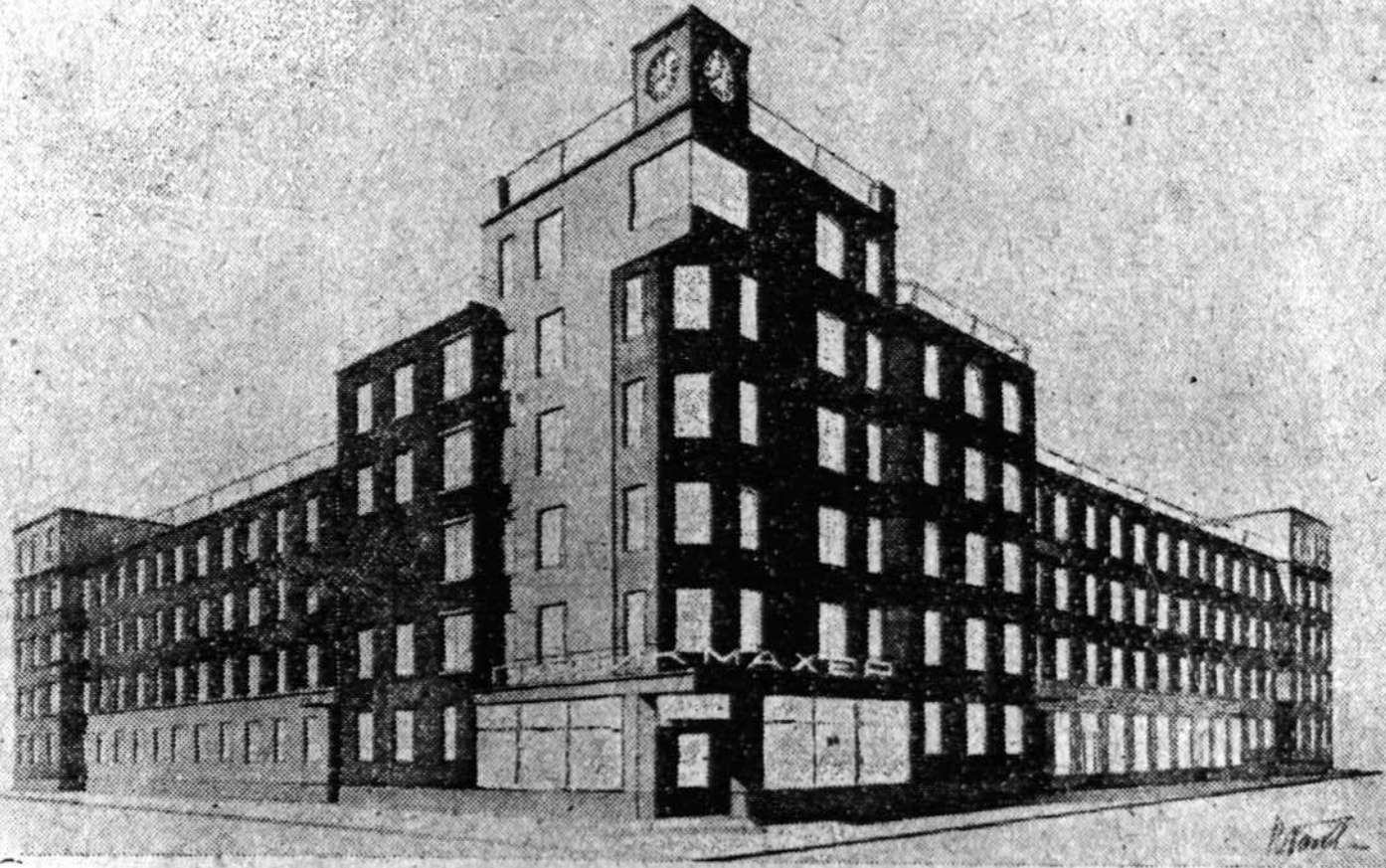
Рис. 1. РЖСКТ. 185-квартирный дом на 2-м рабочем поселке.