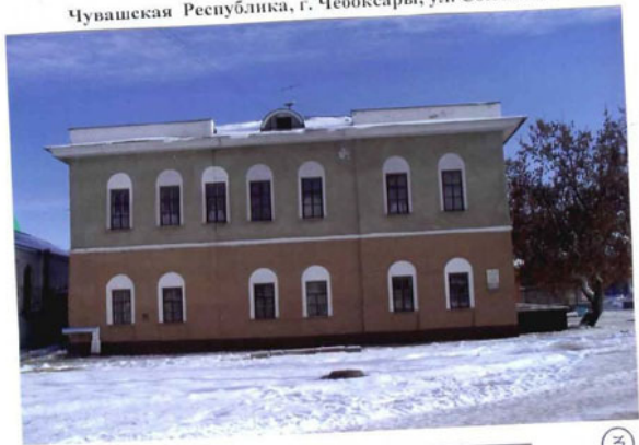
Дом Соловцова Чувашская Республика, г. Чебоксары, ул. Союзная, 23