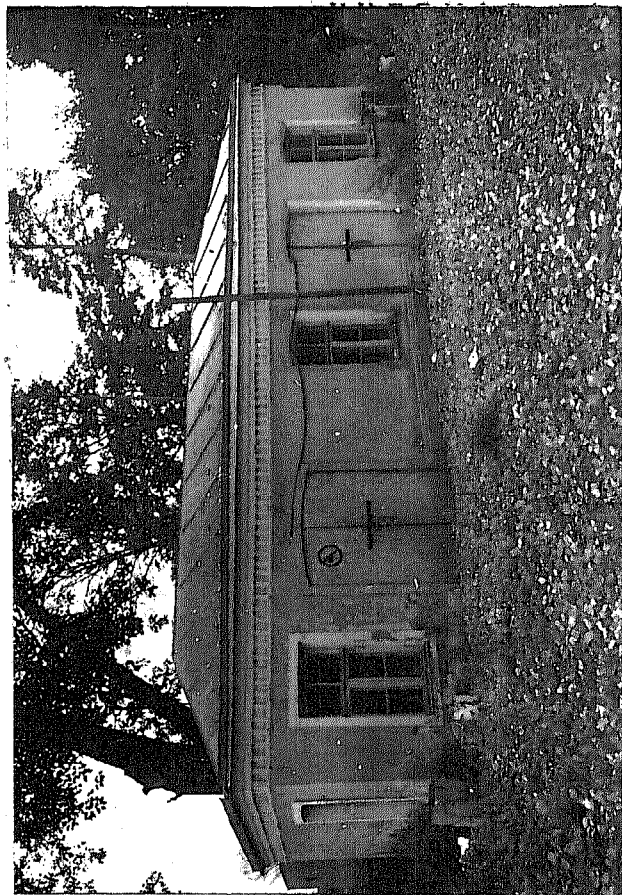
Т О Ч К А (оборотная сторона)