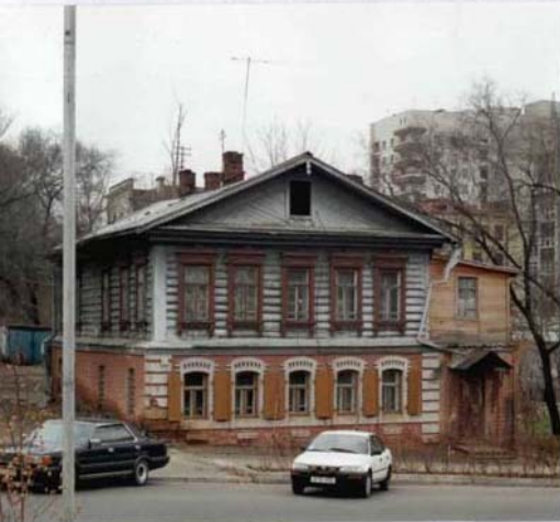
Фото или схематический план