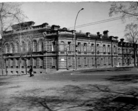
Фото или схематический план